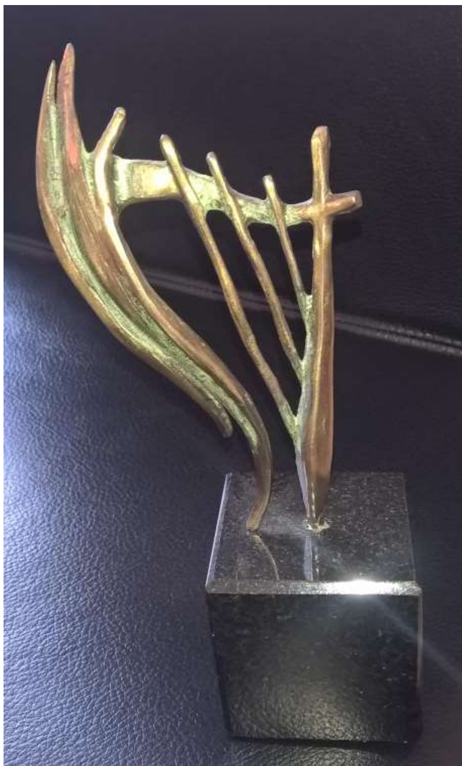
Tomasz Wenklar artysta rzeźbiarz