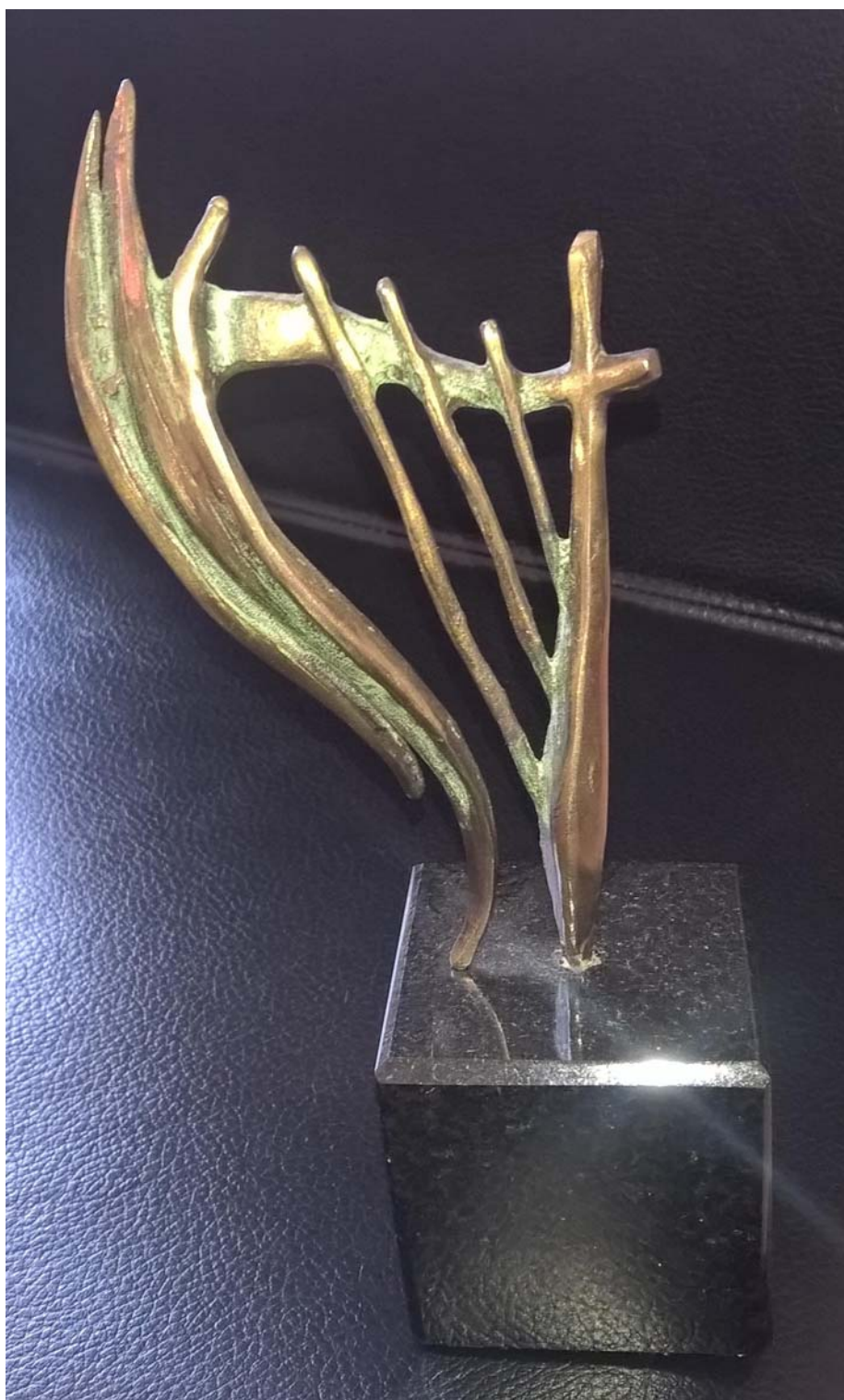
Tomasz Wenklar artysta rzeźbiarz